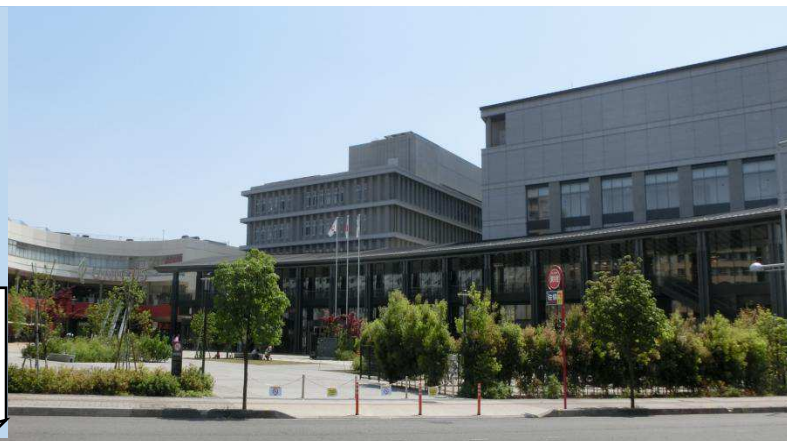
会場となる川越市「ウエスタ川越」