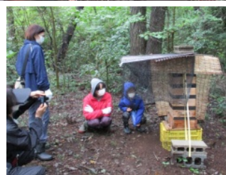
巣箱を見守る 八二ーBeeのメンバー