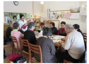
幸茶店 ある日の食卓