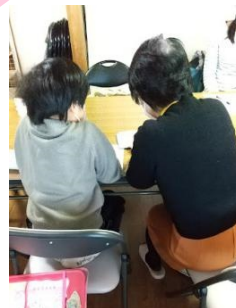
マンツーマンでの学習支援