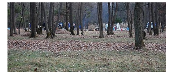
落ち葉は三富の森の恵み

近年、地主の高齢化などで土地を手放す人や手入れが行き届かず、下草を刈り取ることもできない状態になっている場所もあり、保存のため地域の人々による落ち葉はきなどが行われています。ハニーBeeの養蜂は、この自然を守ることにもつながっています。最近では、巣箱の隣で畑作をする農家さんが、「蜂、飼っているんだもんね」と農薬の散布を控えてくれていて、地域の理解も進んでいます。