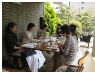
介護予防サロン 「手仕事しましょう」