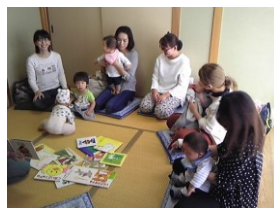
写真上：わいわい夕食会 下：歌と絵本の会