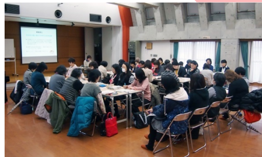
越谷生活館ホールにて