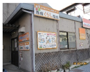
くらし組合の事務所

運営し手作り無添加の美味しいパンを作り、販売、喜んでもらおうと日々頑張っているそうです。