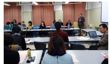
2日目の分科会(第8分科会)