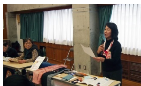
自慢の製品を見せてアピールする 「リフォームいと」

最初にワーカーズ・コレクティブとは何か、という説明をしました。働く人の協同組合であるワーカーズは、たすけあい、分かち合う精神をもとに自分たちで出資して地域に必要な働き場を作り、ものやサービスを提供してきました。事業で得た収入から家賃、光熱費、労働報酬などを引き、残った分が剰余ですが、ワーカーズ・コレクティブは剰余を出すことを目的としない非営利団体です。剰余が出る場合でも内部に積み立て、次の地域貢献事業への資金