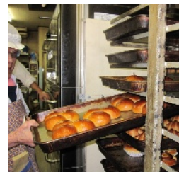
ポッポの 焼きたてパン

ポッポさんは25年前の1988年設立で、設立者自身が重度の身体障がいを抱え何とか自活したいとの思いのもとに開店したとのこと。現在、障がい者8人と健常者3人で「ポッポベーカリー」を