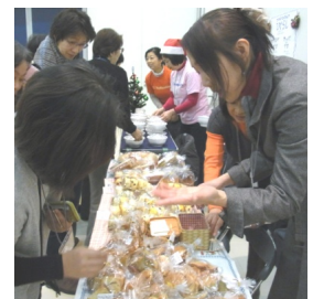
ブースでワーカーズのアピール

「介護保険・改定して、いい仕組みになったの？」 誰もが自分らしく暮らし続ける為の“ささえ”になってくれるのか？