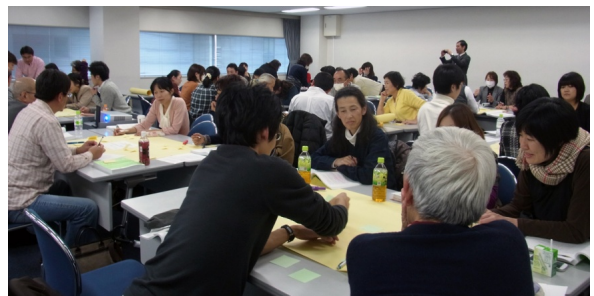
第5分科会 ワークショップ