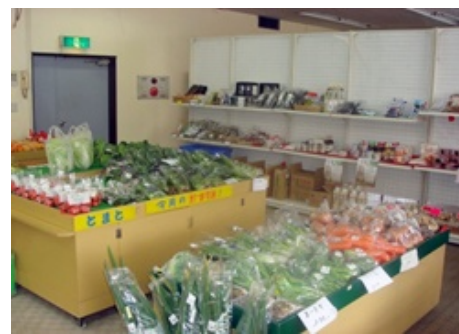
越谷市蒲生交流館の店舗「とれとれ越谷」

本来であれば、「ワーコレこしがや」の名称が消費者に浸透し、馴染んでおりましたが、新たな意気込みの門出として「ワーコレとれとれ越谷」の名称で発足いたしました。