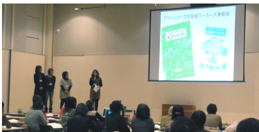
活動報告・グリーンコープ(九州)

WNJが主催してワーカーズまつりが開催されました。午前中に福祉連絡会フォーラム、午後は全国の仲間の事例報告、会場にはワーカーズの品物や被災地カンパグッズが並べられ 2012 国際協同組合年の締めくくりになりました。