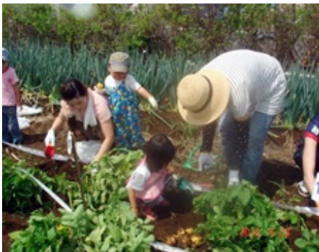
じゃがいも掘り収穫体験会開催