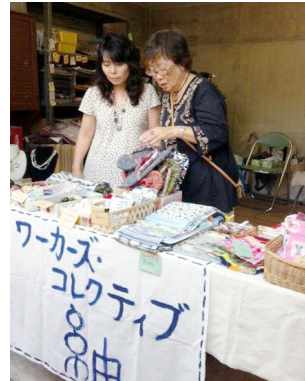
所沢地域協議会のまつりにて手作り品の販売

開催は概ね毎週 2 回水曜日と木曜日で、毎回 4 ~ 6 人位の参加があり約 8 坪のスペースがミシン