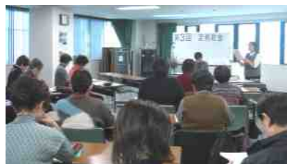
「この指とまれ!」総会 2008.11

お互い様の助け合いの精神は、気持ちだけでは回らない。責任ある核となるものがしっかりと支えてこそ地域が豊かになっていくのだろう。（広報チーム）